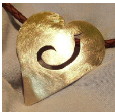
Herzanhänger 925 Silber mit Monogramm ziselierter Oberfläche