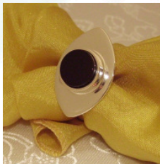
„Black Eye“ 925 Silberring mit runder Onyxplatte