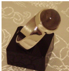
925 Silberring mit rundem Dumortierit