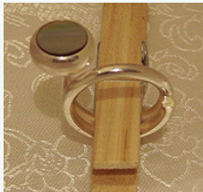
„Posthorn“ 925 Silberring mit runder Perlmuttereinlage