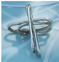
925 Silberkrenz aus Silberdraht gewickelt, glänzend poliert