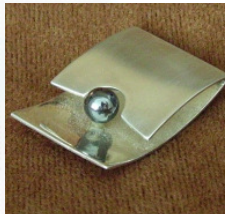
Kettenanhänger 925 Silber mit Hämatit- kugel, Oberfläche: glänzend/mattiert