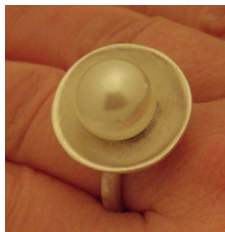
Perlring® 925 Silberring mit Süßwasserperle