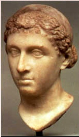
Büste Cleopatra Altes Museum Berlin

Die Legenden, die sich um die unsagbare Schönheit und die Macht der ägyptischen Königin Cleopatra ranken sind so bekannt, dass man den Namen Cleopatra fast unweigerlich mit Bädern in Eselsmilch assoziiert, mit denen Sie ihre Schönheit pflegte. Ihre Macht und ihren Reichtum unterstrich sie jedoch besonders durch eine große Vielfalt an außergewöhnlichen Schmuckstücken aus Silber und Gold die