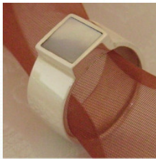
925 Silberring mit Perlmuttereinlage quadratische Fassung